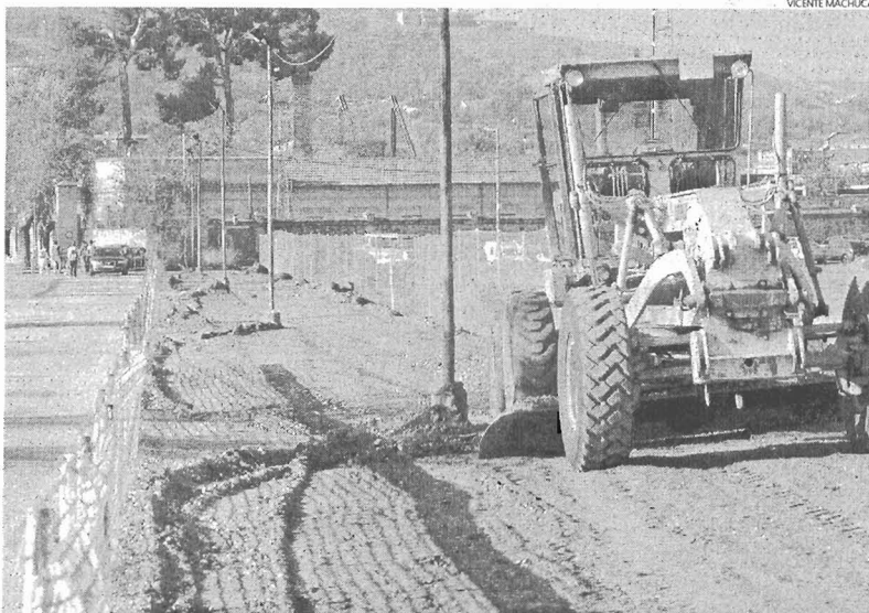
La remodelación arrancaba el lunes con el derrumbe "simbólico" de la antigua Puerta de Obreros

El alcalde critica que algunas administraciones se laven las manos con la conservación del patrimonio