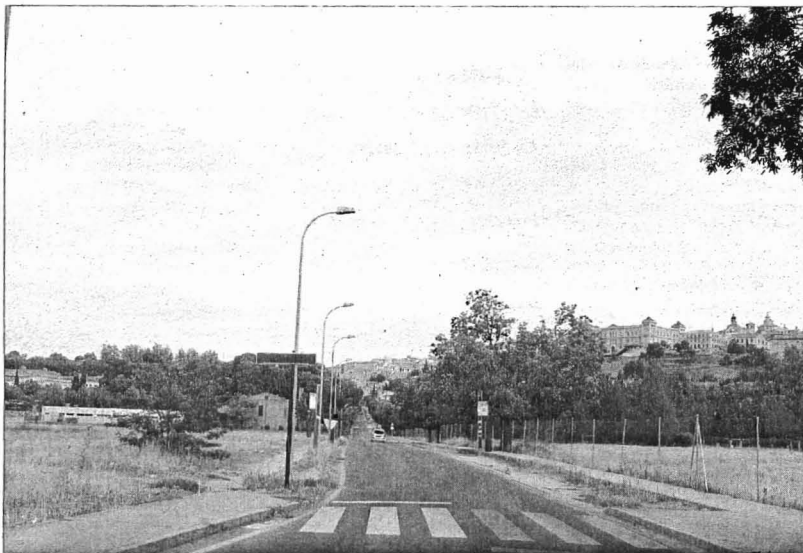
Las obras en Carlos III comenzarán en noviembre.

CARRIL BICI. Otra gran novedad que trae el proyecto será la incorporación por primera vez a la zona del carril bici, que se extenderá en los próximos meses al resto de viales de las inmediaciones. El objetivo, explica Nicolás, es crear un circuito completo que se unirá en un futuro con el que se incluirá en el nudo norte. «Con lo cual tendremos todo lo que se ha llamado nudo norte y nudo sur con la posibilidad de circular por bicicleta», explica Nicolás. Hay que tener en cuenta que en la zona, una de las más llanas de la ciudad, está el