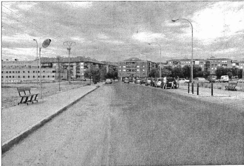
La prolongación de la calle México también se verá renovada.

► Circo Romano. Una actuación más profunda que la de los viales será la remodelación del Circo Romano. Allí habrá que tener muy en cuenta los trabajos arqueológicos. Será en este proceso cuando se pongan en valor tanto los restos del Parque Escolar, como el arco abandonado tras la Venta de Aire, cuyo estado de decrepitud llama la atención. Además, la actuación también acondicionará el aparcamiento disuasorio que existe en la zona, y tratará de ganar más plazas.